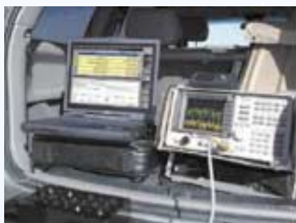
ציוד למדידת Passive Intermodulation